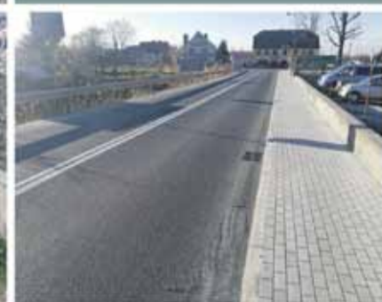
Remont ul. Przemysłowej w Ziębicach 2019